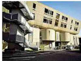
Il blocco dell'Umberto I dove la giovane è stata aggredita