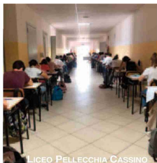
LICEO PELLECCIA CASSINO