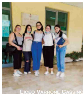
LICEO VARRONE CASSINO

Tutto ha funzionato regolarmente, le mascherine erano raccomandate ma non obbligatorie. Tutti con la testa alla seconda prova di domani quella multidisciplinare