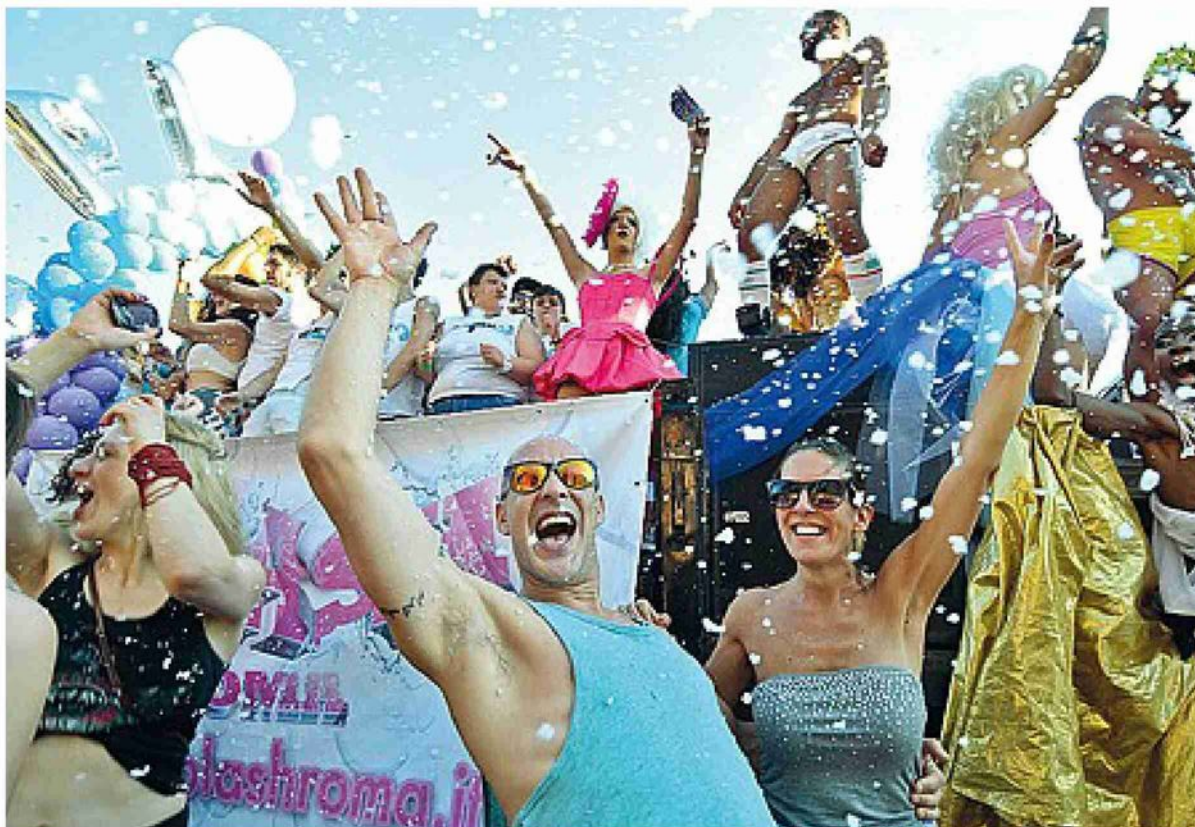
Festa arcobaleno Una immagine del Gay Pride a Roma nel 2013. L'evento è previsto a Rieti sabato 11 settembre

● Già sindaco di Rieti dal 1994 al 2002, è stato rieletto nel 2017. Consigliere regionale sia nelle elezioni del 2005, sia in quelle del 2010, è stato assessore alla Cultura nella giunta di Renata Polverini